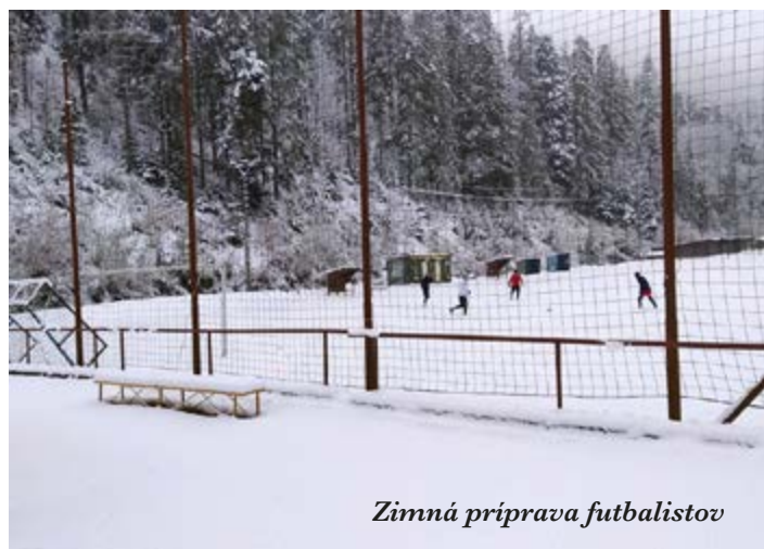
Zimná príprava futbalistov