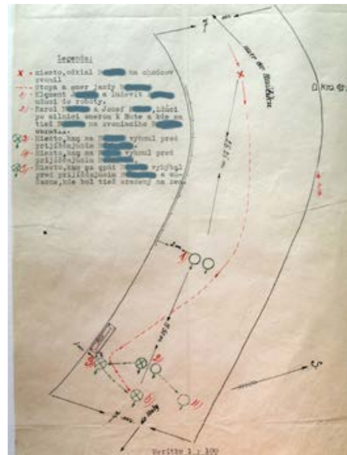
Náčrt vyhotovený četníkmi zobrazujúci situáciu pri nehode aj s vysvetlivkami (ŠAPO – Spišský archív Levoča, KS-L 376)